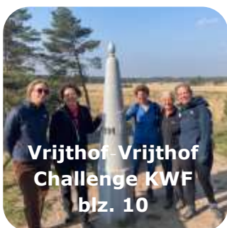
Vrijthof-Vrijthof Challenge KWF blz. 10