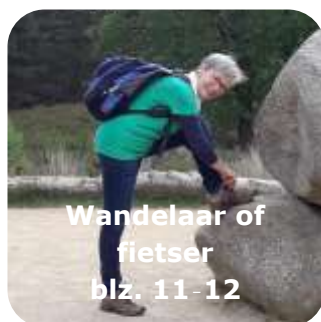
Wandelaar of fietser blz. 11-12