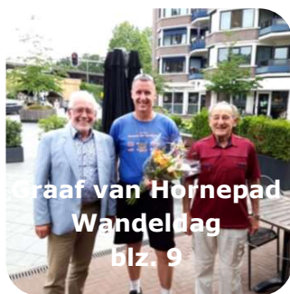
Graaf van Hornepad Wandeldag blz. 9