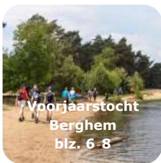
Voorjaarstocht Berghem blz. 6-8